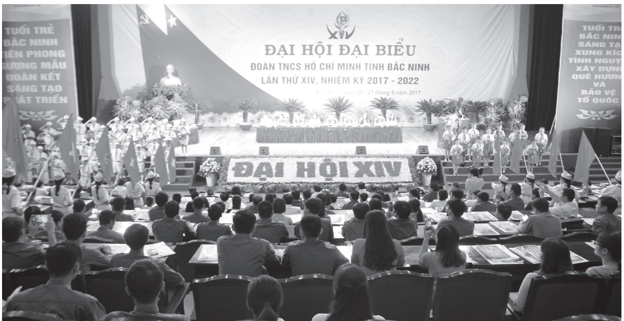
Toàn cảnh Đại hội.

Nhân dịp này, tôi đề nghị các cấp ủy đảng, chính quyền, các sở, ban, ngành, Mặt trận Tổ quốc và các đoàn thể tiếp tục quan tâm lãnh đạo, phối hợp, chăm lo, giúp đỡ và tạo mọi điều kiện cho thanh niên được cống hiến và trưởng thành, xứng đáng là lực lượng tiên phong xây dựng quê hương ngày càng giàu đẹp, văn minh, góp phần cùng Đảng bộ và nhân dân trong tỉnh đưa Bắc Ninh trở thành thành phố trực thuộc Trung ương vào năm 2022. /.